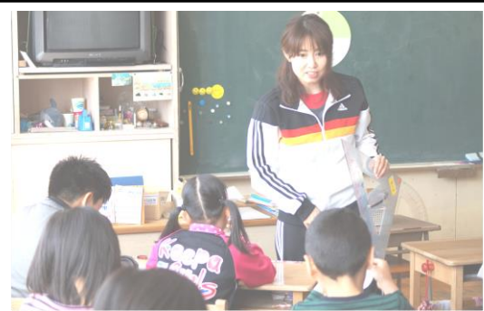
角の大きさについて学習する4年生徒