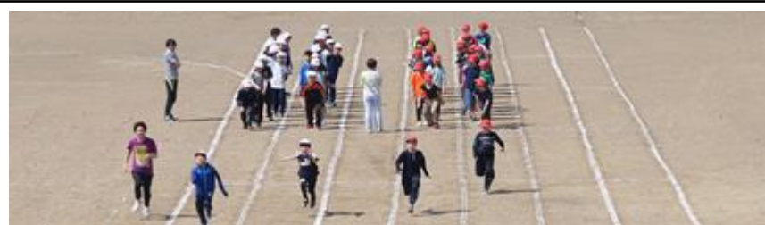
徒競走の練習をする5年生