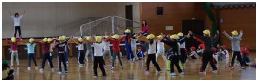
体育館で遊戯の練習をする2年生