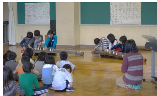
音楽の授業風景（琴を奏でる児童）

左は、音楽の時間で、琴を奏でている授業の様子です。琴1面に3人ずつで取り組んでいました。曲は「さくら さくら」でした。先生は静かに見守っています。