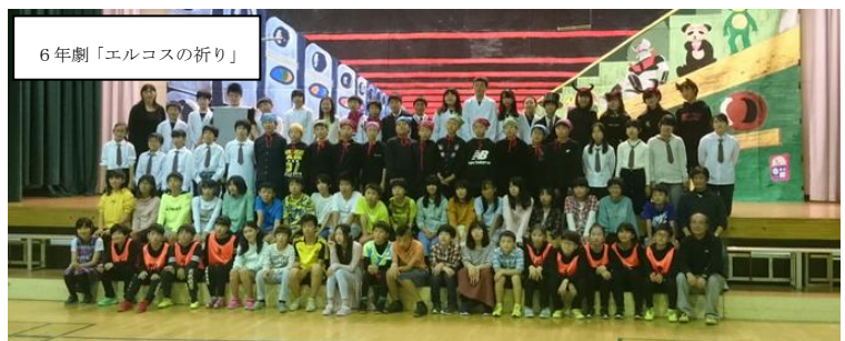
6年劇「エルコスの祈り」