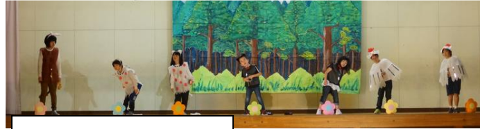
みどり学級劇「プレーメンの音楽隊」↑