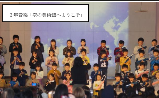
3年音楽「空の美術館へようこそ」