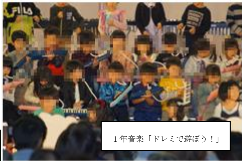
1年音楽「ドレミで遊ぼう！」

ご来校いただいた、保護者・祖父母・地域の皆様、ご来賓の皆様、どうもありがとうございました。