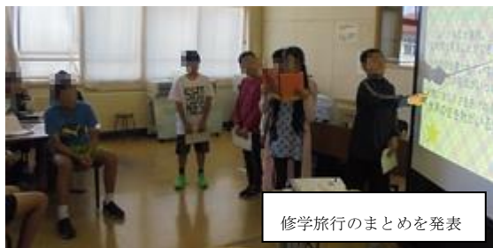
修学旅行のまとめを発表

9月25日に地域公開参観日がありました。昼休み中に行われた全体懇談会にもたくさんの方々に出席していただき感謝しております。また、保護者だけでなく、祖父母や地域の方々、帯広第五中学校や学童の先生方などたくさんの方々にご来校いただきました。どうもありがとうございました。