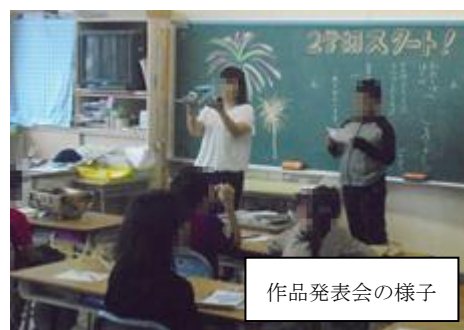
作品発表会の様子

「夏休み作品展」が8月23日・24日に行われました。始業式の日には教室で作品発表会を行っていた学級が多かったです。頑張ったところや苦労したところをみんなに伝えていました。作品展は低・中・高学年別に3つの教室を会場として展示され、子ども達は1時間ずつ作品鑑賞を行いました。どの作品も力作ぞろいで、時間をかけて熱心で作っていた姿が想像できました。見に来てくださった保護者の皆様、どうもありがとうございました。