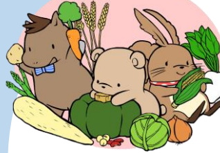
つながりを大切に 体験活動も行います