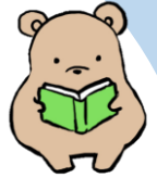
金曜日は、帯広図書館へ 電子図書館も利用できます