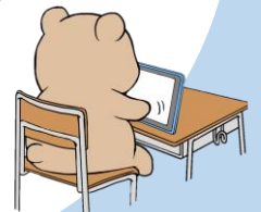
学校の端末を持ち込んで学習 (Wi-Fi環境があります)