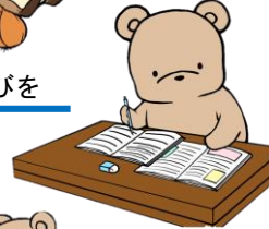
自分のペースで、得意を伸ばしたり 苦手を克服したりします