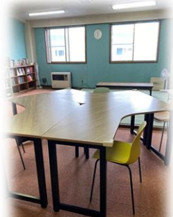
水色の壁紙と、黄色やオレンジのイスなど ワクワクするような雰囲気になっています。