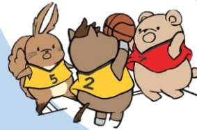
つながりを大切に 体験活動も行います