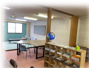
明るくクリーンにリニューアルしました。