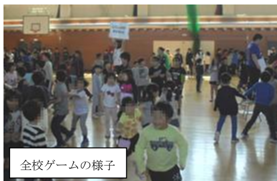
全校ゲームの様子

5月16日になかよし集会がありました。1年生がアーチをくぐって入場したあと、行事クイズや全校ゲームが行われました。1年生は入学して1か月以上が経ち、学校にもずいぶん慣れてきたようです。全校で楽しいひとときを過ごすことができました。また、運動会に向けて応援団の紹介もありました。これから赤組・白組ともにとっても迫力のある応援が繰り広げられそうです。