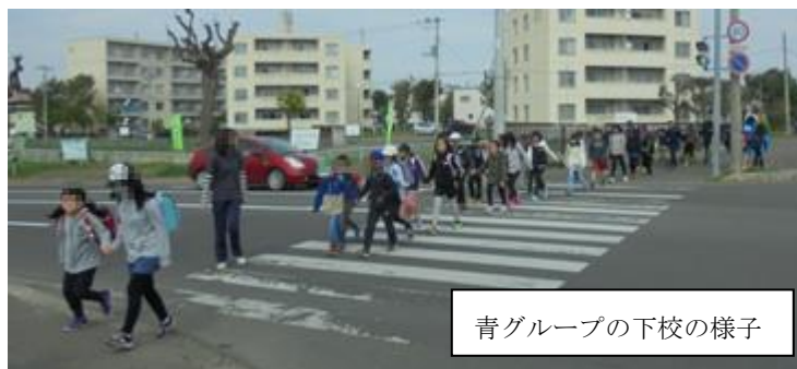
青グループの下校の様子

5月15日に集団下校訓練を行いました。自然災害の発生や不審者の出没などから、下校時の児童の安全を守るために行っています。いざという時に児童も教職員も戸惑わずに実施できるよう訓練しました。集団下校を伴うような災害などが起こらないことを願うばかりです。保護者の皆様には下校に関わる連絡など、ご協力をいただきどうもありがとうございました。